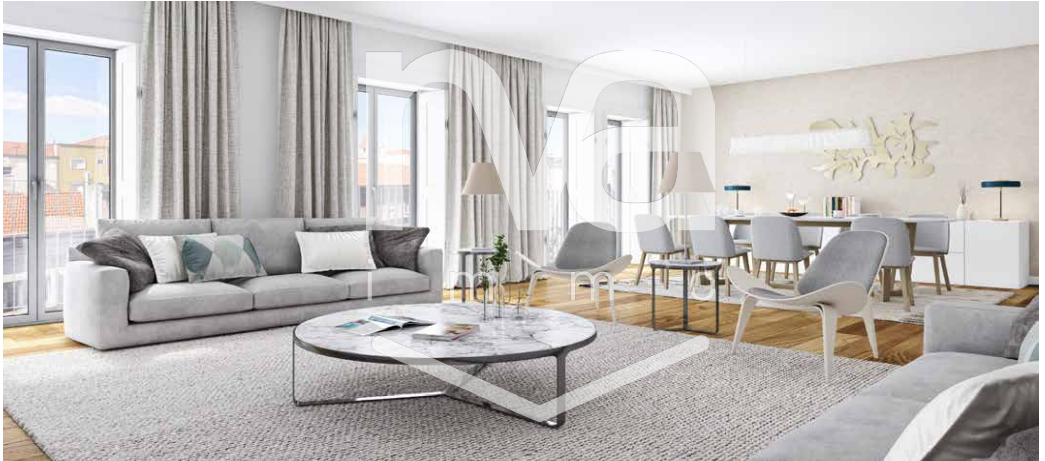
António Augusto de Aguiar Avenidas Novas, Lisboa